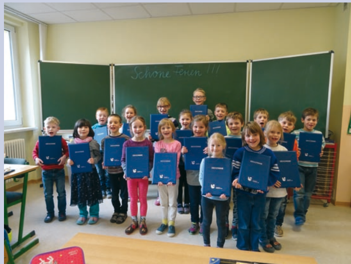
Die Erstklässler der Wildrosen-Grundschule-Dörnthal zeigen stolz ihre ersten Zeugnisse.

Endlich Winterferien! Aber zuvor erhielten alle Schülerinnen und Schüler noch ihre Halbjahreszeugnisse. Ganz besonders werden sich die Erstklässler gefreut haben, sind es doch ihre allerersten Zeugnisse. Damit diese auch immer gut und sicher aufbewahrt sind, haben die Stadtwerke Olbernhau ab diesem Jahr praktische und einheitliche Zeugnis-mappen für alle Erstklässler den drei Olbernhauer Grundschulen übergeben. Ausgestattet mit einem individuellen Deckblatt für jeden Schüler wurden insgesamt 90 Mappen an die Schulen ausgereicht. „Die Bereitstellung der Zeugnis-mappen für die Erstklässler möchten wir in den kommenden Jahren gern zur Tradition werden lassen“, informiert Knut Böttger, Geschäftsführer der Stadtwerke Olbernhau GmbH, „und wünschen damit allen Schülerinnen und Schülern weiterhin viel Freude und Erfolg beim Lernen.“