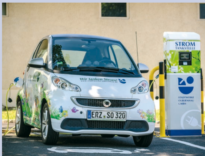
Erste Strom-Tankstelle für Olbernhau im Areal Saigerhütte

Mit dem Ausbau des Postparkplatzes sollen weitere Ladesäulen im Stadtzentrum von Olbernhau folgen.