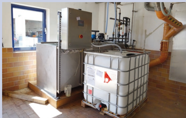
Zur Schlammentwässerung ist die Zuführung eines Polymer erforderlich. Die Polymeranlage wurde ebenfalls neu errichtet und gehört als Bestandteil zum Entwässerungsprozess mit einer Schneckenpresse dazu.