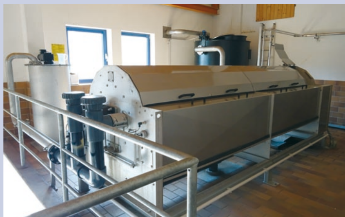
In der Schneckenpresse werden am Ende des Klärvorganges Wasser und Trockenmasse getrennt.

In diesem Jahr wurde in der Kläranlage Olbernhau eine neue Schneckenpresse in Betrieb genommen. Sie ersetzt die in die Jahre gekommene Zentrifuge, die bisher die Entwässerung des Faulschlammes aus dem Faulturm übernommen hatte. Die Schneckenpresse steht nahezu am Ende der Prozesskette, die zur Reinigung unserer Abwässer notwendig ist. Hat sie ihre Arbeit verrichtet, kann die vom Wasser getrennte Trockenmasse zur Wärmeerzeugung in ein Heizkraftwerk verbracht werden. Ein großer Vorteil der neuen Anlage ist der wesentlich geringere Energieverbrauch und die damit verbundene Kostenersparnis gegenüber der alten Zentrifuge.