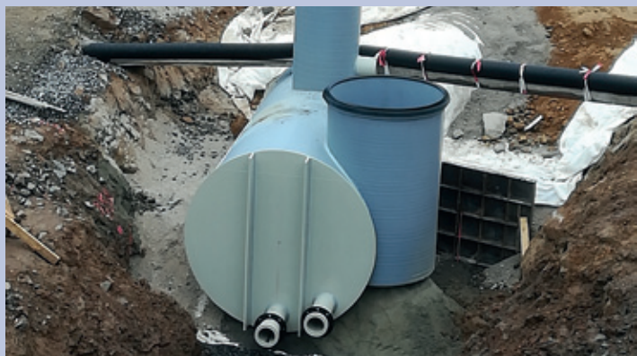
Errichtung eines Stauraumkanals im Zuge des Rückbaus der Kläranlage Pfaffroda

schluss zwischen Dittmannsdorf und Pfaffroda hergestellt. In der Ortslage Dittmannsdorf kommt dabei über 1,8 Kilometer ebenso das grabenlose horizontale Bohrspülverfahren zum Einsatz. Die Kläranlage Pfaffroda wurde bereits stillgelegt. Im Jahr 2020 ist nach Abschluss der Baumaßnahmen die Stilllegung der Kläranlage Sayda geplant.