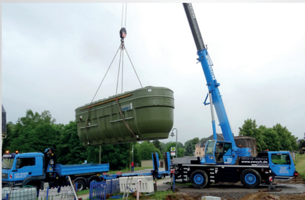
Die neue vollbiologische Kleinkläranlage wird an ihren Platz gehoben.

Neben der zusätzlichen Reinigungsstufe bietet die Anlage weitere Vorteile. Der Stromverbrauch ist gegenüber der alten Anlage um ein Vielfaches geringer. Der Prozess der Abwasserreinigung läuft selbstregulierend, so dass zusätzliche Kulturen und Chemikalien nicht notwendig sind. Die Anlage läuft wartungsarm, geräuscharm und ohne Geruchsbelästigungen. Sie ist so konstruiert, dass sie auch Schwankungen im Zufluss ausgleichen kann und damit durchgehend für eine optimale Abwasserreinigung sorgt.